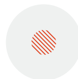
Cristalline Soft-AD™ povrch

Anatomicke implantáty sú obľúbené pre prirodený výsledný vzhľad a taktiež pre schopnosť korigovať tvar a ochabnuté tkanivo poprsia. 2